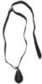
Fettuccia con carrucola Tape with pulley