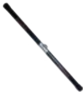
Barra da trazioni da 72 cm Bar for lat machine cm 72